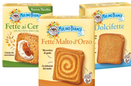
FETTE BISCOTTATE MULINO BIANCO DOLCIFETTE/LE RUSTICHE/ AI CEREALI/MALTO D'ORZO 315G