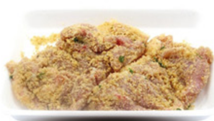
COSCE DI POLLO GRATINATE