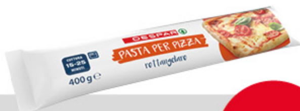
Pasta per pizza Despar 400g