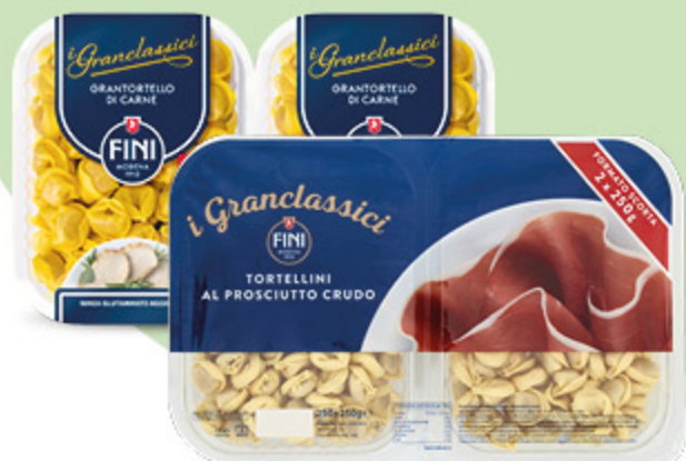
TORTELLINI FINI PROSCIUTTO CRUDO/ GRANTORTELLI DI CARNE 250GX2