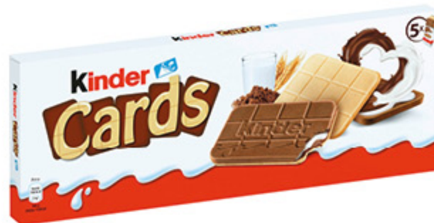
KINDER CARDS 128G