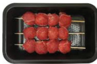
BOMBETTE DI SUINO CON SPECK E SCAMORZA