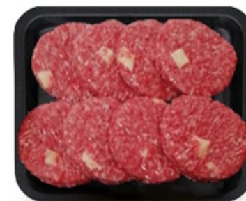
HAMBURGER SPECK E PROVOLA