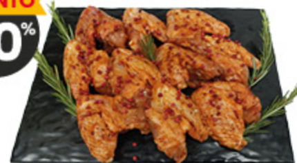
ALI DI POLLO SAPORITE