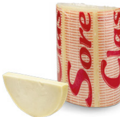
PROVOLONE PICCANTE SORESINA