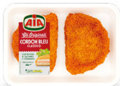
CORDON BLEU X2 AIA 245G