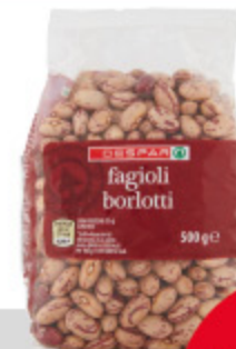
Fagioli borlotti Despar 500g