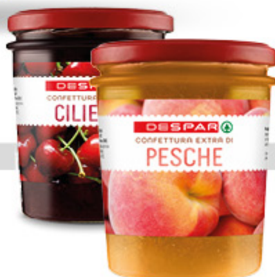
Confettura extra Despar 340g