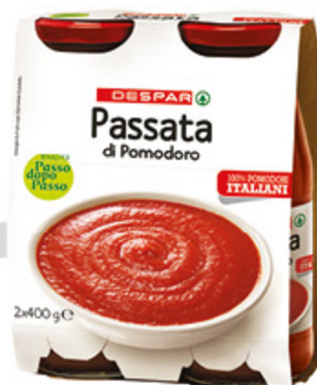
Passata di pomodoro Despar 2x 400g