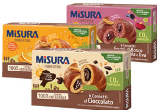
CORNETTO MISURA VARI GUSTI 298/308G