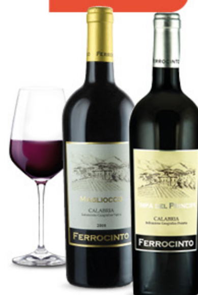
VINO FERROCINTO VARI TIPI 75CL