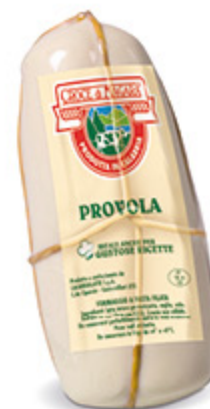
PROVOLA CROCE DI MAGARA CALABRIA