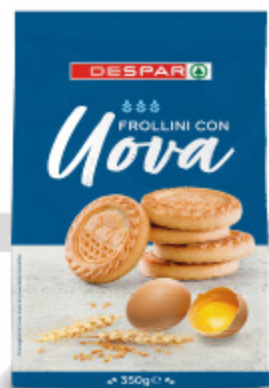
Frollini con uova Despar 350g