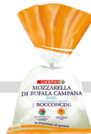
Mozzarella di bufala Campana DOP 50g x5