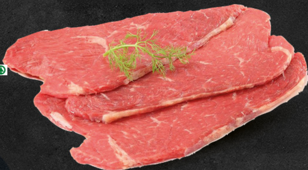
FETTINE SCELTE DI VITELLONE (BOVINO ADULTO) DESPAR PASSO DOPO PASSO