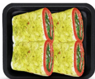
TORTILLAS CON SPECK