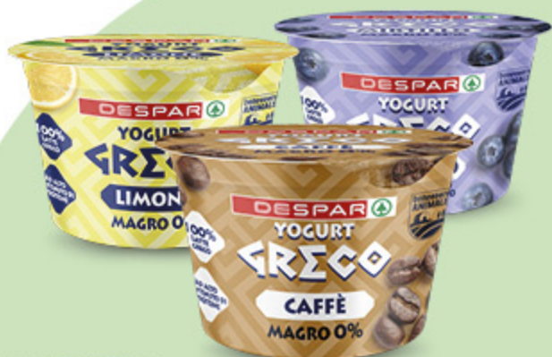
YOGURT GRECO MAGRO 0% DESPAR VARI GUSTI 150G