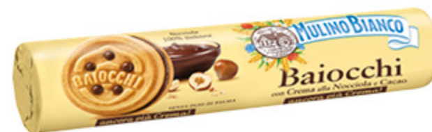
BAIOCCHI MULINO BIANCO NOCCIOLA 168G