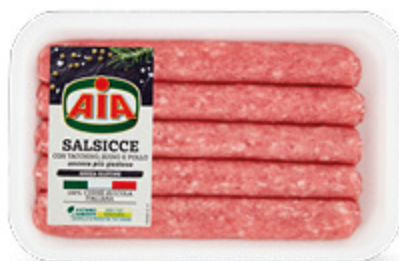
SALSICCE CON TACCHINO, POLLO E SUINO AIA 400G