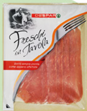
PROSCIUTTO CRUDO AFFETTATO DESPAR 100G