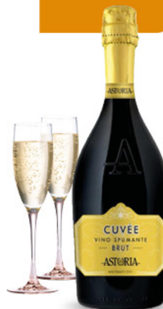
SPUMANTE CUVÉE BRUT ASTORIA 75CL