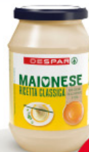
Maionese Despar 480g