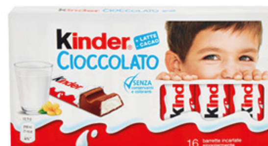
KINDER CIOCCOLATO 200G