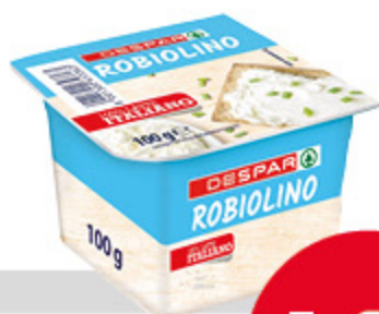
Robiolino Despar 100g