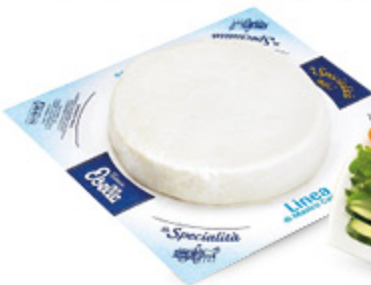
FORMAGGIO FRESCO OSELLA