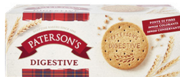
BISCOTTI DIGESTIVE PATERSONS 400GX12