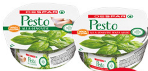
Pesto alla genovese Despar classico/ senz'aglio 90g