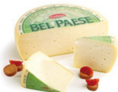
BEL PAESE GALBANI