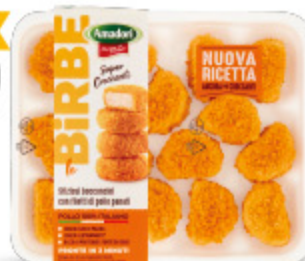
BIRBE DI POLLO AMADORI 300G