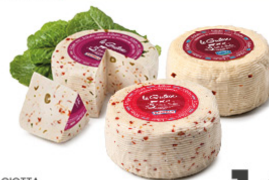
CACIOTTA ZAPPALÀ VARI TIPI