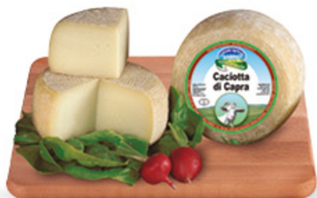
CACIOTTA DI CAPRA AZIENDA AGRICOLA SABINO