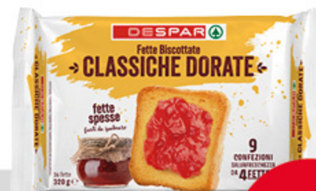
Fette biscottate classiche Despar 320g