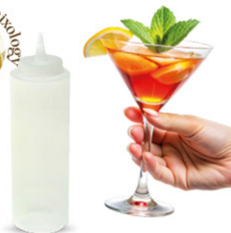
BOTTIGLIA PET TRASPARENTE 0.3LT 2,29