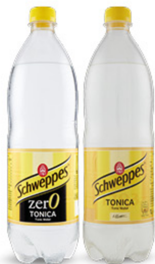
SCHWEPES TONICA CLASSICA/ ZERO 1L 1,09