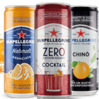
BIBITA SAN PELLEGRINO VARI GUSTI LATTINA DA 33CL 0,59 1.70 €/L

S.PELLEGRINO Le bibite Italiane dal 1932