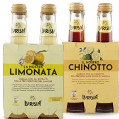
BIBITE LURISIA VARI TIPI 275MLX4 4,79 4.35 €/L

Un viaggio sensoriale tra le eccellenze italiane Capolavori di gusto e qualità, realizzate con ingredienti unici, accuratamente selezionati con un tocco iconico.