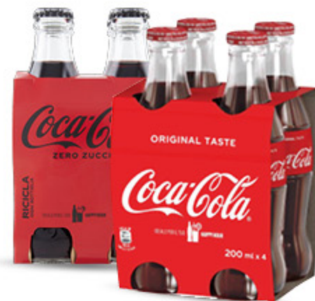
BIBITA COCA COLA IN VETRO CLASSICA/ZERO 20CLX4 3,79 4.74 €/L