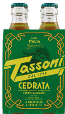
CEDRATA TASSONI 18CLX4 2,99

Con cedri Diamante selezionati e distillati a vapore in antichi alambicchi in rame del 1872. Una bevanda analcolica tutta Italiana.