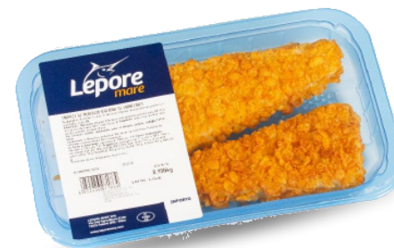
TRAPEZI DI MERLUZZO D'ALASKA AI CORNFLAKES