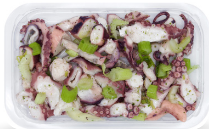
INSALATA POLPO E SEDANO 250G