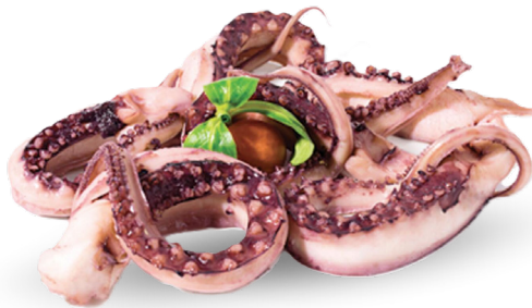
TENTACOLI DI TOTANO GIGANTE DEL PACIFICO DECONGELATI