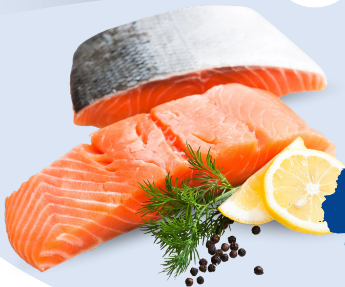
FILETTO DI SALMONE