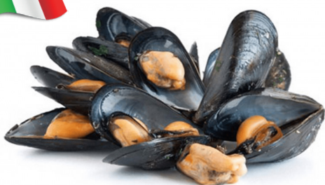
COZZE NERE SFUSE ALLEVATE IN ITALIA