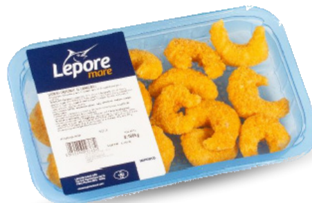
GAMBERI CROCCANTI AI CORNFLAKES 180G