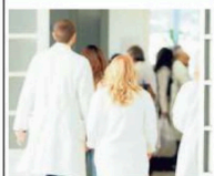
▲ Ieri il test per il concorso

La mafia foggiana sbarca a Venezia per 115 minuti. Con le sue faide, gli amori proibiti, e una donna che si oppone ad un destino già scritto. E' il Gargano aspro e cupo che segna il debutto in concorso alla prossima mostra. ● a pagina 8