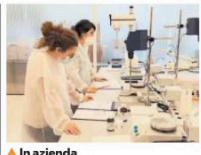
In azienda I laboratori Farmalabor a Canosa

se di dati clinici condotti sugli adulti, generando problemi che legati al dosaggio, all'efficacia e alla sicurezza del medicinale, senza soddisfare i bisogni terapeutici nelle diverse fasce di età». Da qui la necessità di mettere in campo ricerche mirate con il coinvolgimento di dottorandi, studenti dei master, giovani ricercatori sia dell'accademia che di aziende private, come di giovani laureati in farmacia, chimica e tecnologiche farmaceutiche. Si tratta di quattro sessioni