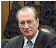
L'ex senatore Salvatore Ruggeri

Una lista che sarebbe stata messa in piedi da alcuni suoi «fedelissimi» - tra cui ex ed attuali amministratori gallipolinesi - la cui posizione è al vaglio degli inquirenti: